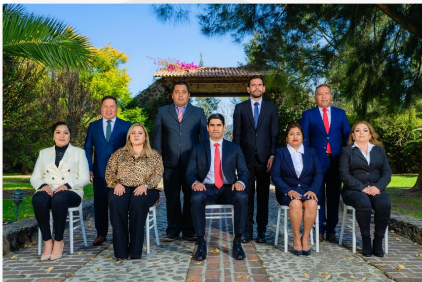
Integrantes de Cabildo Ayuntamiento de Temascalcingo 2022-2024

JUNTOS POR TEMSCALCINGO GOBIERNO MUNICIPAL 2022-2024